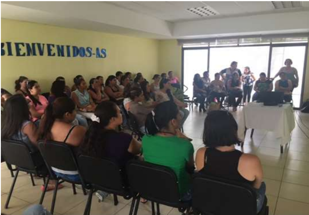
Beneficiarios del proyecto en capacitación en el IAFA.

Ese proyecto fue tan exitoso que en se replicó en Palmares y en la zona norte de San Ramón con otros nombres.