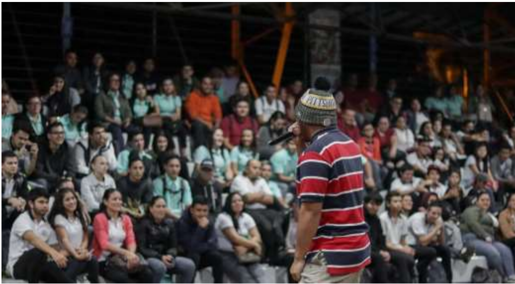
Presentación en Cámara de Ganaderos

A raíz de la pandemia el proceso cayó y en este momento algunos jóvenes están acercándose a la institución porque han incrementado su consumo y otros porque les interesa continuar con el proceso; aspecto que se está valorando para el 2024.